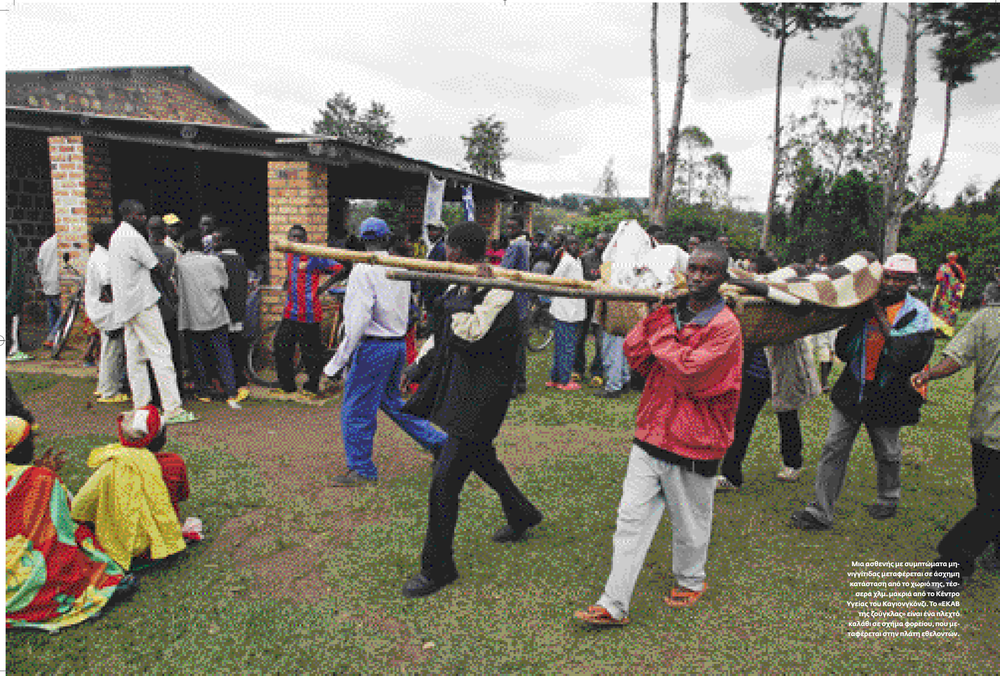
Μια ασθενής με συμπτώματα μη-νιγγίτιδας μεταφέρεται σε άσχημη κατάσταση από το χωριό της, τέσσερα χλμ. μακριά από το Κέντρο Υγείας του Καγιονγκόνζι. Το «ΕΚΑΒ της ζούγκλας» είναι ένα πλεχτό καλάθι σε σχήμα φορείου, που μεταφέρεται στην πλάτη εθελοντών.