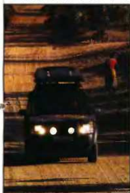
ΧΙΛΙΟΜΕΤΡΑ χωματόδρομων «καταπίνουν» καθημερινά οι δύο Έλληνες.