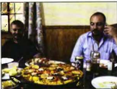
Καλή φαίνεται η «παέγια» που γεύτηκαν οι δύο ταξιδευτές στη Μαυριτανία

● Οι Έλληνες ταξιδευτές που θα γυρίσουν τον κόσμο σε 800 ημέρες έφτασαν στο δυτικότερο άκρο της Αφρικής