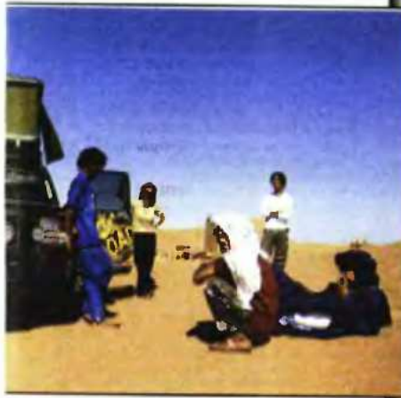
με συνοδεία τους Τουαρέγκ