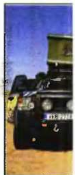
Καταμεσές στην έρημο