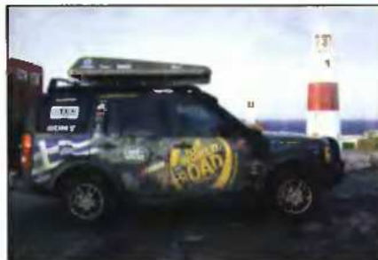
Στον Φάρο του Γιβραλτάρ

Ο γύρος του κόσμου σε 800 ημέρες από τους δύο θαρραλέους και αποφασισμένους συμπατριώτες μας Ακη Τεμπεριόδη και Βούλα Νέτου συνεχίζεται, καθώς η αποστολή έχει φτάσει στο δυτικότερο άκρο της Αφρικής έπειτα από 50 ημέρες και 10.000 χιλιόμετρα.