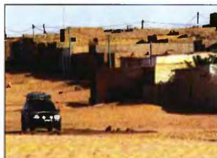
Έξω από τα παλάτια στο Τσιγκκετίτο πέρασε η ελληνική αποστολή, από εδώ περνάει και το Dakar

Στην Νουαντίμπου το μέλη της αποστολής φιλοξενήθηκαν από έναν από τους ελαχιστούς Έλληνες της Μαυριτανίας, τον Νικόλα Γεωργιάδη, και στη συνέχεια πήραν την εκτός δρόμου δια-