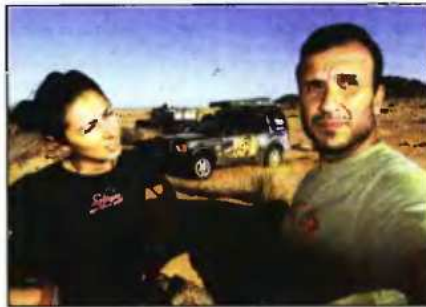
Μετά από 300 χλμ off road στη Σαχάρα η κόπωση είναι εμφανής στα πρόσωπα των δύο ταξιδευτών