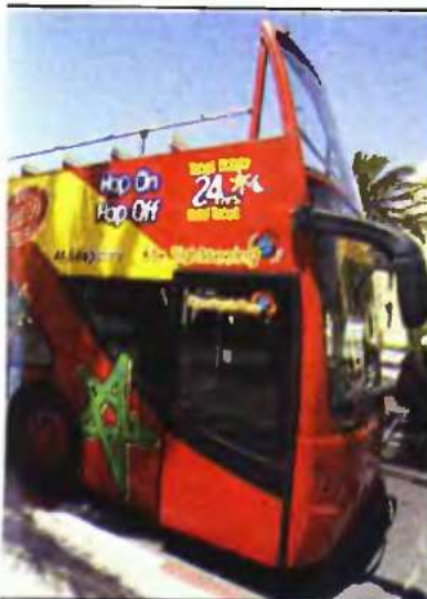
ίο στο Μαρακές