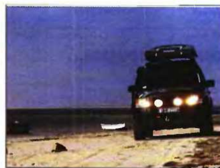
Ξημέρωμα στην παραλία της Νουαντίμπου